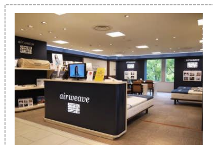
全国各地に次々と新店舗がOPEN!

快適な寝心地が評価され、トップアスリート、JAL国際線ビジネスクラスやファーストクラスをはじめ、石川県和倉温泉「加賀屋」全室等様々な採用実績があります。