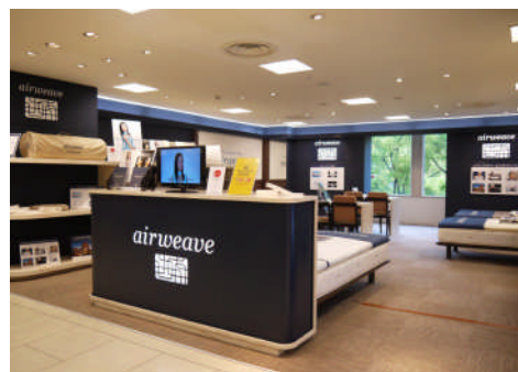
全国各地に続々と新店舗がOPEN。

快適な寝心地が評価され、トップアスリート、ANA国際線ファーストクラス、JAL国際線新ビジネスクラス、石川県和倉温泉「加賀屋」全室にとり入れられるなど、様々な採用実績があります。