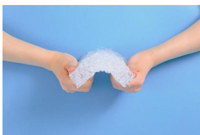
①復元性(体重を押し返す力)が高く睡眠時