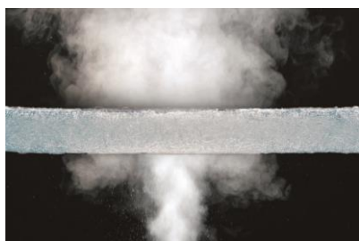
③通気性抜群で夏は蒸れにくく、冬は空気断熱で暖かい