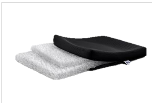
▲中材は二層構造のエアファイバー