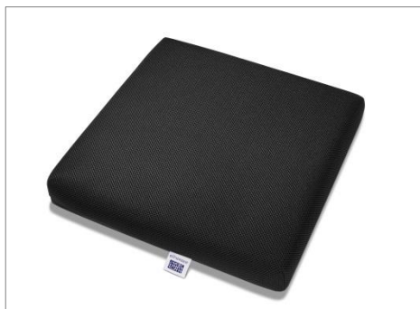
▲エアウィーヴ 車いすクッション

弊社は2019年4月よりウェルネス領域に本格参入し、「エアウィーヴ ウェルネスモデル」を発売しております。車いすクッションを第2弾商品とし、すべての人々が快適に暮らせる社会を目指し、ウェルネス領域でも製品の開発を続けてまいります。