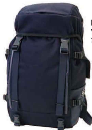
BACK PACK(S) W270/H510/D150mm ¥55,000