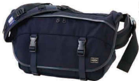
MESSENGER BAG W350/H270/D180mm ¥42,000