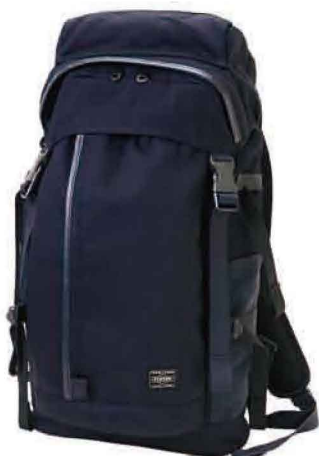
BACK PACK(L) W300/H550/D200mm ¥64,000